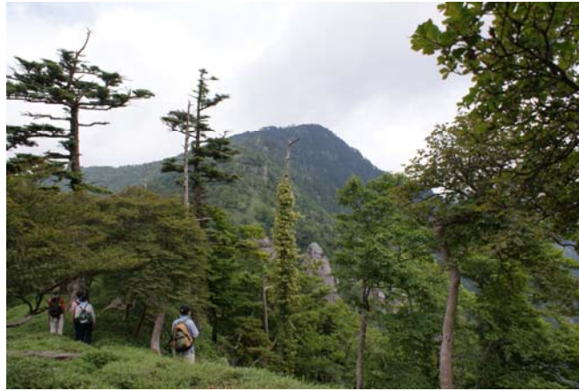
コースから望む釈迦ヶ岳

千年の歴史を超える「大峯奥駈道（おおみねおくがけみち）」。時を越え現在も修験道の山伏が厳しい修行を行うこの道は、2004年7月に“紀伊山地の霊場と参詣道”として世界遺産登録されました。「大峯奥駈道」は大峰山脈の縦走路にあり、紀伊半島の中央部を吉野から熊野へと走る標高 1000mから 2000m級の急峻な峰々が連なるところです。その原生林や渓谷は近づき難い清浄さを今もたたえています。